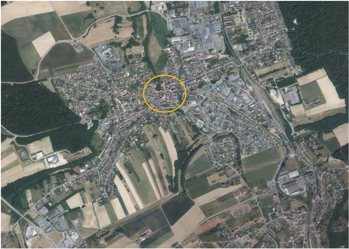
Delle au XXIème siècle