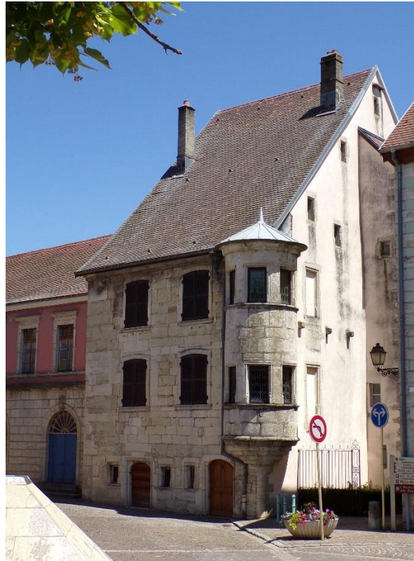
La maison à tourelle