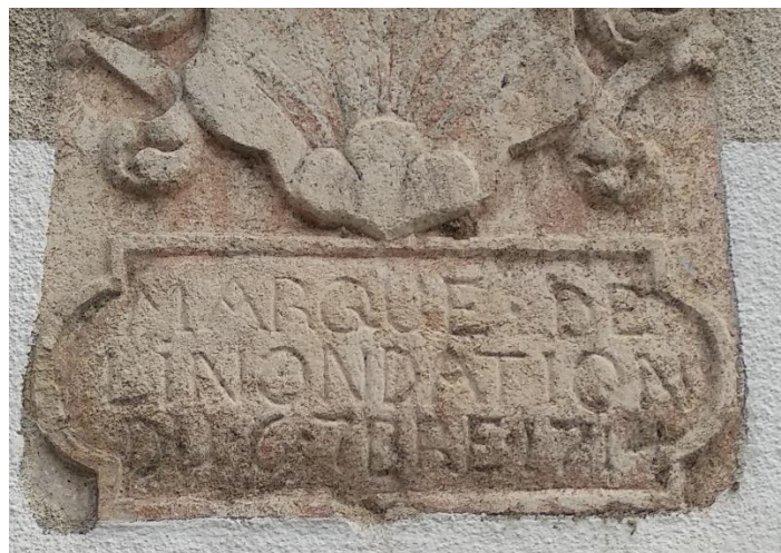
La marque de l'inondation de 1714