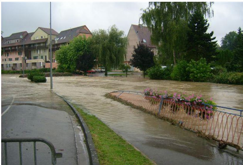
Inondation de 2004