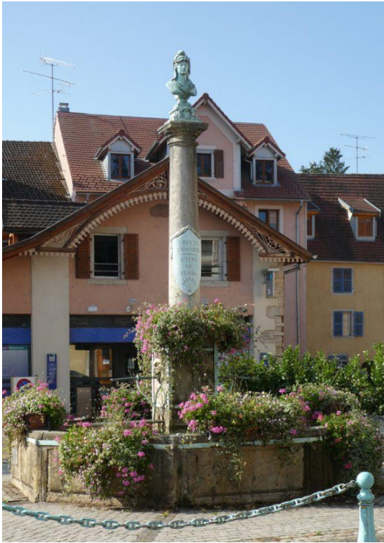
La grande fontaine

En repartant, vous regarderez sur votre droite, côté sud de la place, vous pourrez apercevoir la « Maison des Remparts » construite en 1576 par le prévôt de Delle Jean-Guyat Loyv. Après la révolution elle a servi de gendarmerie jusqu'en 1976. Aujourd'hui elle abrite l'Hostellerie des Remparts, une des meilleures tables de la ville et le caveau dédié aux concerts de jazz.