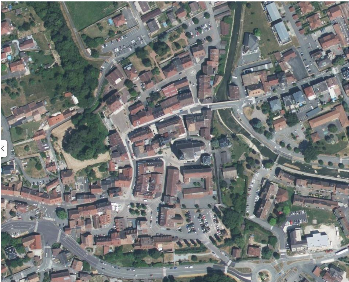
Zoom sur le Vieux Delle