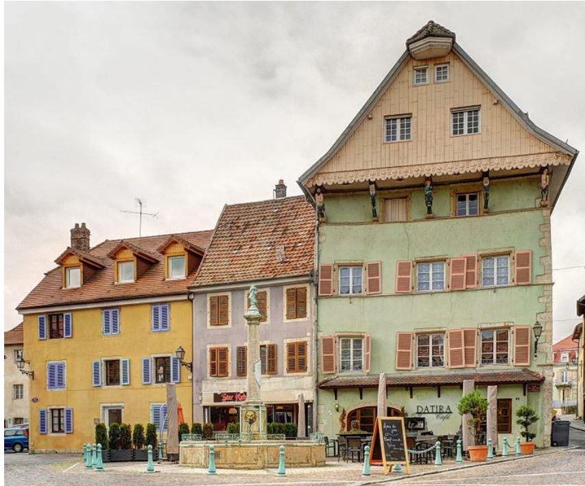
Maison des cariatides

En r'païchaint vôs raivoét'rèz chu vot'drète, â meûdi d'lai piaïce : vôs porèz aivisaïe lai « Mâjon des Muraïyes » (La Maison des Remparts), conchtrute en 1576 pai lou prévôt de Dèlle Djean-Guyat Lovy. Aiprès lai Gròsse Eur'jippe, èlle é fait eûsaidge de dgendârm'rie d'junqu'en 1976. Adjed'heû èlle ât otiupèe pai « l'Hostellerie des Muraïyes », ènne des moyïuses tâles d'lai vèlle et pai in tçhaivè po lai musitye de jazz !