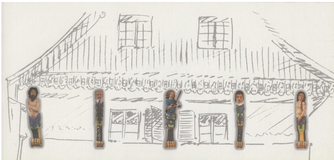
Les 5 cariatides